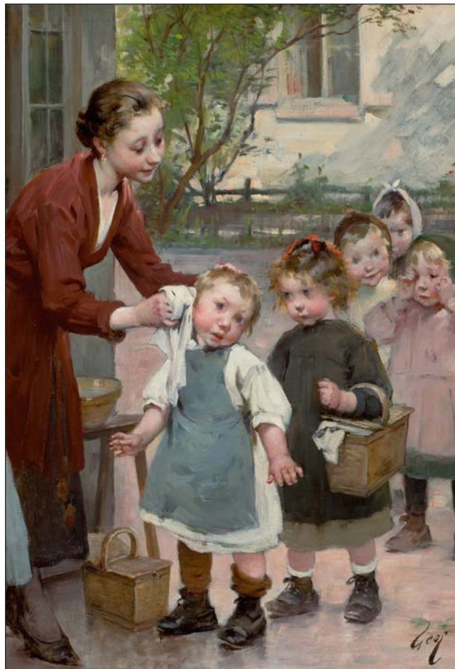
The Teacher's Touch, Henri-Jules-Jean Geoffroy

Dnes neexistují opravdoví Učitelé. A pokud existují, dříve nebo později musí opustit svůj idealismus, aby se mohli věnovat drsnému ekonomickému boji o přežití nebo aby neztratili práci. Pro učení je třeba trochu více svobody, a především je třeba vědět, co se bude učit. Nikdo