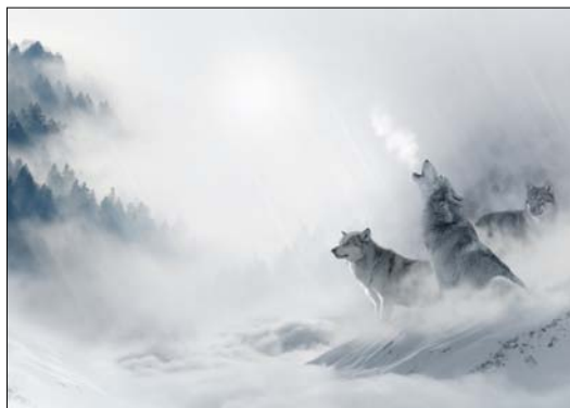
MŮŽEME SE UČIT OD VLKŮ?