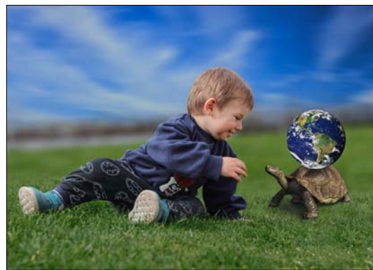
GAIA - MATKA ZEMĚ