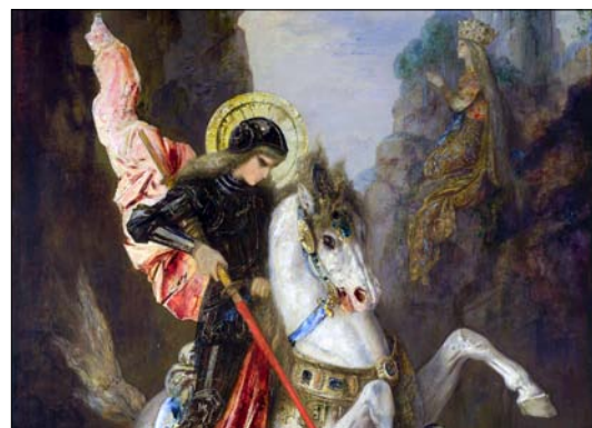
KOŘENY TRADICE SV. JIŘÍ