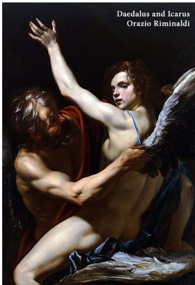
Daedalus and Icarus Orazio Riminaldi

i dochovaná čelenka z peří posvátného ptáka quetzala, která snad patřila poslednímu aztéckému vládci Montezumovi.