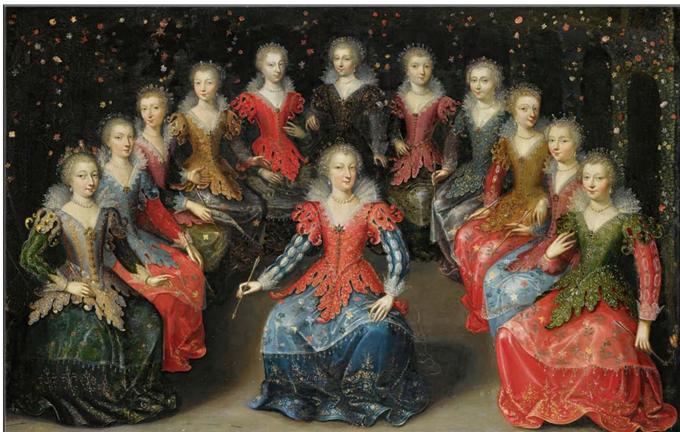
An Allegory Of Love, Claude Dérue